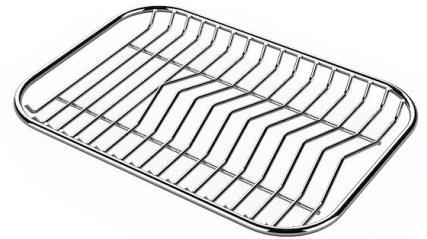
Griglia portapiatti inox