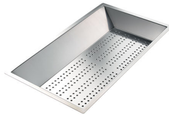
Vaschetta forata inox 8151 000 * solo in abbinamento con l'accessorio 8644 101