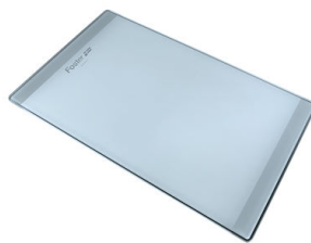
Tagliere in cristallo